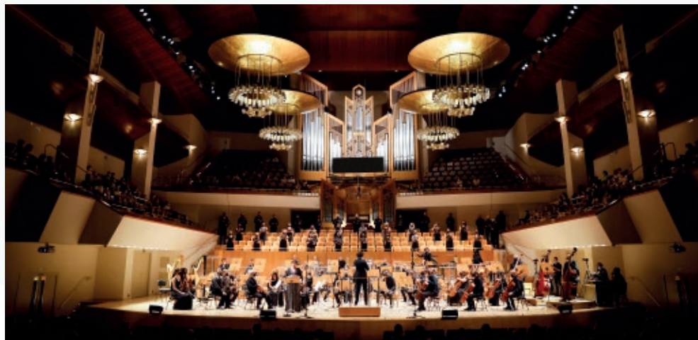
Sala Sinfónica del Auditorio Nacional de Música